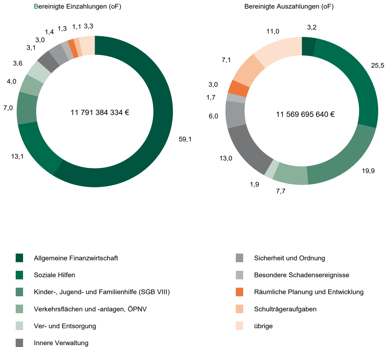
Abb. 1 Bereinigte Einzahlungen und Auszahlungen der kommunalen Kernhaushalte des Freistaates Sachsen 2017 nach ausgewählten Produktbereichen (in Prozent)