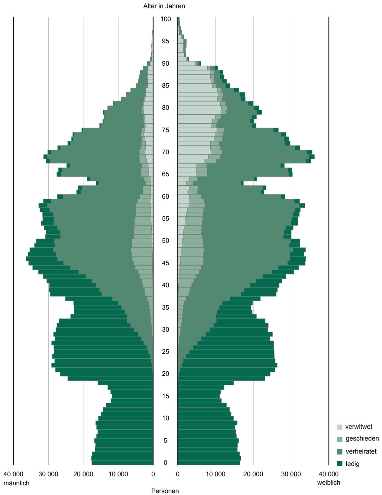
Abb. 1 Bevölkerung des Freistaates Sachsen am 31. Dezember 2009 nach Alter, Familienstand und Geschlecht