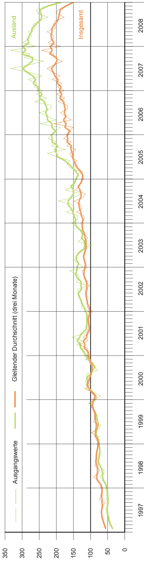
Abb. 1 Index des Auftragseingangs - insgesamt und Ausland - im Verarbeitenden Gewerbe in Sachsen von Januar 1997 bis Dezember 2008 1) 2000 = 100