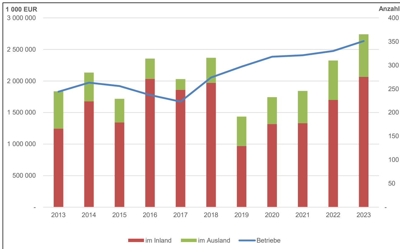
Grafik 2: Betriebe 1 und Umsatz mit Gütern und Leistungen für den Umweltschutz in Schleswig-Holstein 2013 - 2023