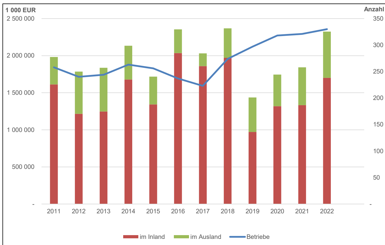
Grafik 2: Betriebe 1 und Umsatz mit Gütern und Leistungen für den Umweltschutz in Schleswig-Holstein 2011 - 2022