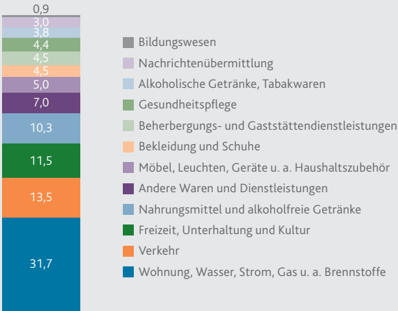
Wägungsschema zum Basisjahr 2010 in %