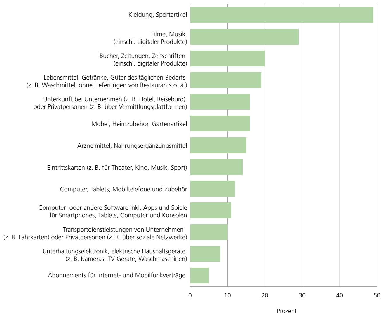
A3 | Einkäufe und Bestellungen über das Internet nach Art der Waren und Dienstleistungen in Prozent

Deutliche Unterschiede der Internetaktivitäten zu privaten Zwecken zeigten sich bei zusätzlicher Betrachtung des Bildungsstands. Besonders hoch war der Unterschied beim Internet-Banking. Rund 28 % der befragten Personen in Nie-