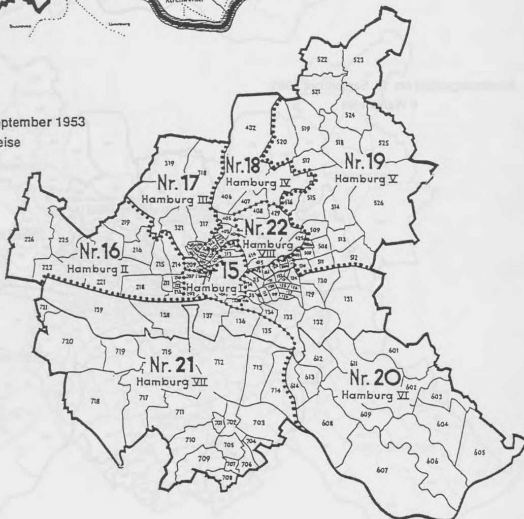
Bundestagswahl am 6. September 1953 8 Wahlkreise