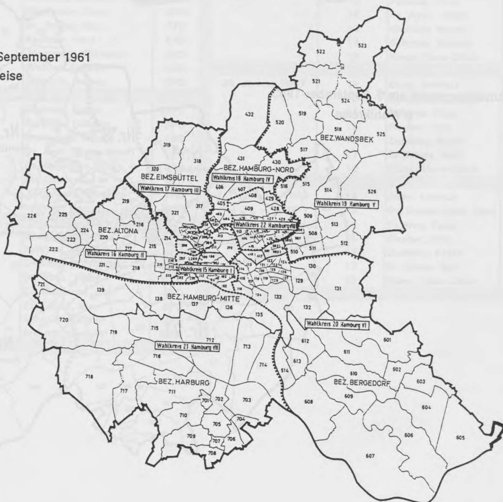
Bundestagswahl am 17. September 1961 8 Wahlkreise