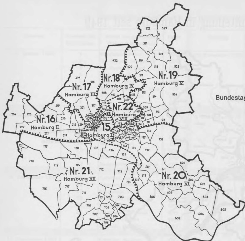
Bundestagswahl am 15. September 1957 8 Wahlkreise