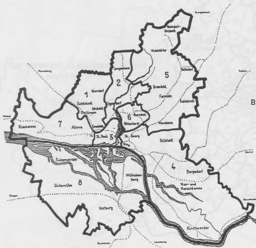
Bundestagswahl am 14. August 1949 8 Wahlkreise