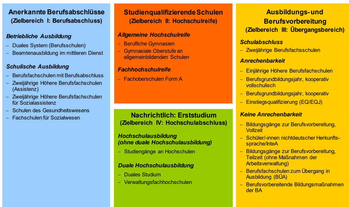
Abbildung 1: Das Zielbereiche-Modell