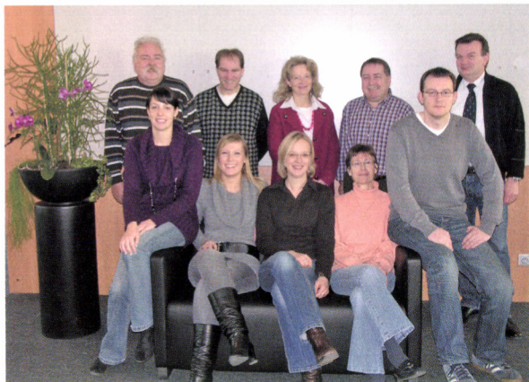
AuF-Team in Wiesbaden

Das Team der Aus- und Fortbildung (AuF) plant und organisiert Deine Ausbildung.