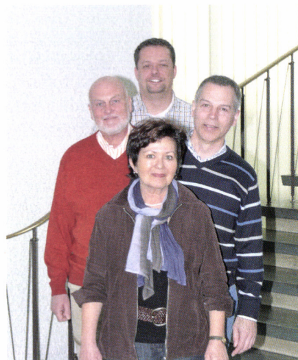
Ausbildungs-Team in Bonn

Einige Mitarbeiterinnen und Mitarbeiter der Aus- und Fortbildung waren selbst einmal Auszubildende im Statistischen Bundesamt. Sie wissen aus eigener Erfahrung, wie die Ausbildung abläuft, welche Probleme auf die Auszubildenden zukommen können.