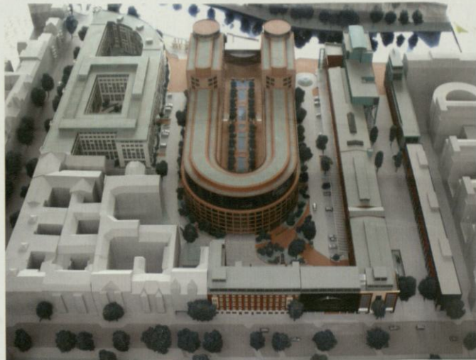
Ein Gebäudemodell vom Bundesministerium des Innern (BMI) am Ufer der Spree (oben im Bild) in Berlin-Tiergarten.