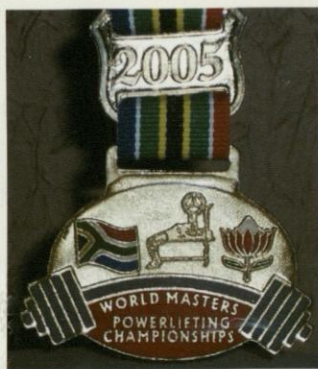
Die Goldmedaille im Bankdrücken.

Seine bisherigen persönlichen Bestleistungen im Kraftdreikampf: Kniebeuge mit 280 Kilogramm, Bankdrücken mit 225 Kilogramm und Kreuzheben mit 235 Kilogramm. Ergibt