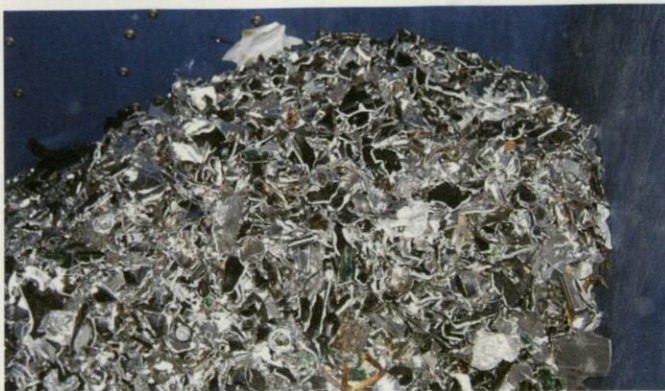
... und nach ihrer Behandlung.