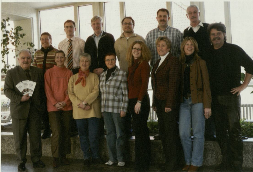
Die Kolleginnen und Kollegen des Referats VII C 2 in der Zweigstelle Bonn.

Kostenstrukturstatistiken gehören zu den renommiertesten Statistiken, die vom Statistischen Bundesamt erhoben werden. Gerade in Zeiten knapper Ressourcen nehmen Kostenstrukturbetrachtungen in Unternehmen an Bedeutung zu.