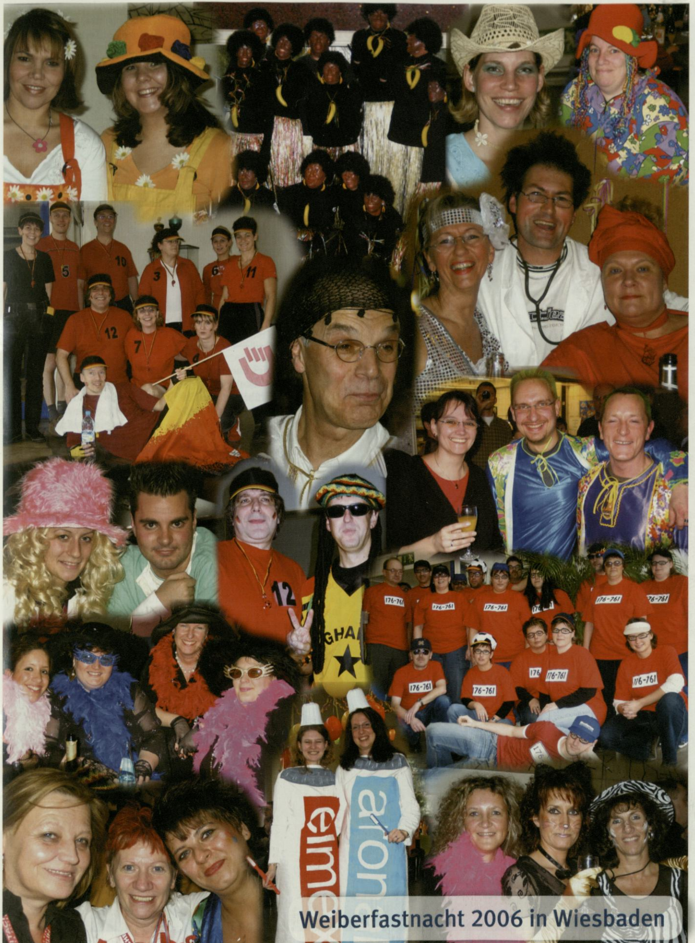
Weiberfastnacht 2006 in Wiesbaden