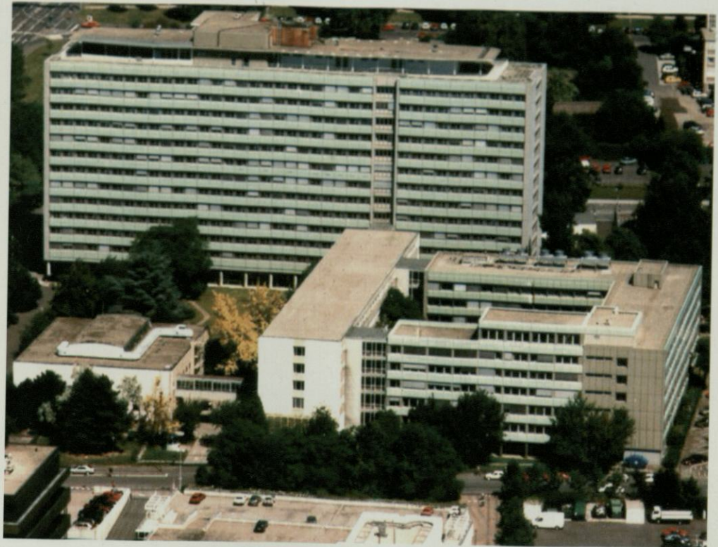
Der Hauptsitz des Statistischen Bundesamtes in Wiesbaden - wie wird er wohl nach der Sanierung aussehen?

Es wurden verschiedene Objekte besichtigt, von denen manche in Betracht kommen und einige absolut ungeeignet sind, aber die meisten in Betracht kommenden Objekte stehen derzeit leer und die Vermieter sind sehr interessiert, aber einen Mietver-