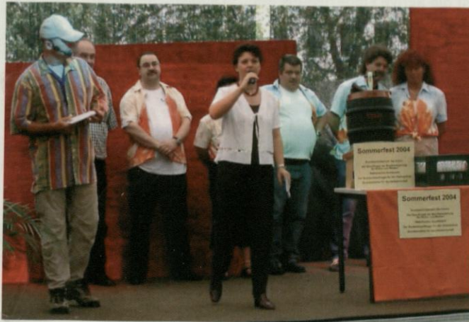
Staatssekretärin Ute Vogt (Mitte) aus dem Bundesinnenministerium eröffnete - wie im Vorjahr - das Sommerfest in der Bonner Liegenschaft.