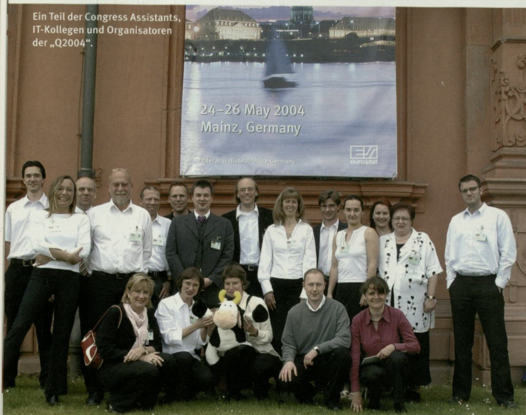
Ein Teil der Congress Assistants, IT-Kollegen und Organisatoren der „Q2004“.