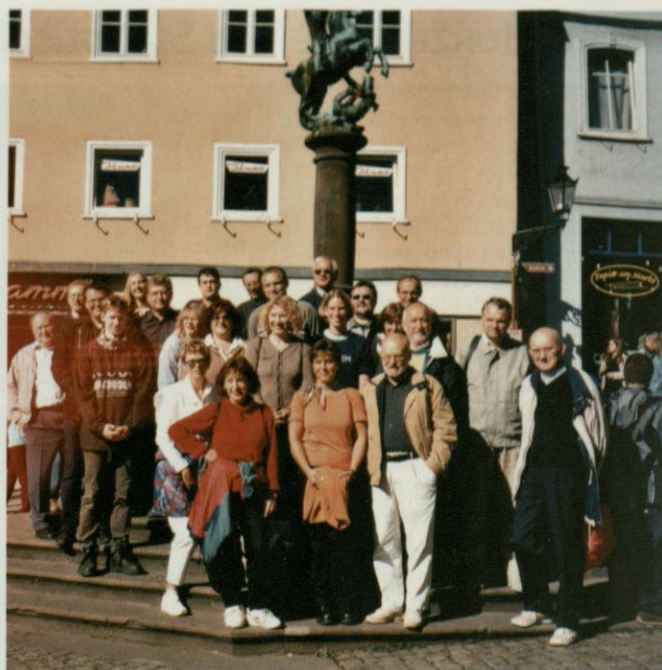
Ein Teil der Ausflügler der Abteilung IV, versammelt vor einem Marburger Brunnen.

Ein weiteres Highlight war das Hotel Restaurant Dammühle, das von Marburg aus über Wehrhausen nach rund sechs Kilometern zu erreichen war. Seit 1811 wird hier Gastwirtschaft betrieben und die Mühle ist seit 1521 dokumentiert.