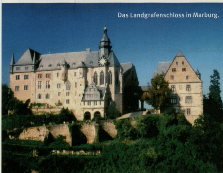
Das Landgrafenschloss in Marburg.