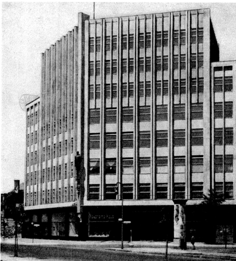
Zweigstelle Berlin des Statistischen Bundesamtes