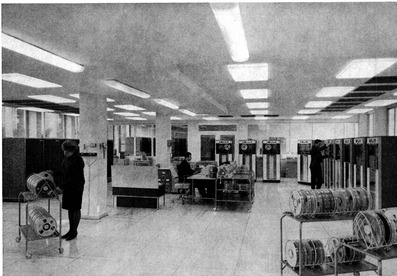
Elektronische Großrechenanlage im Statistischen Bundesamt