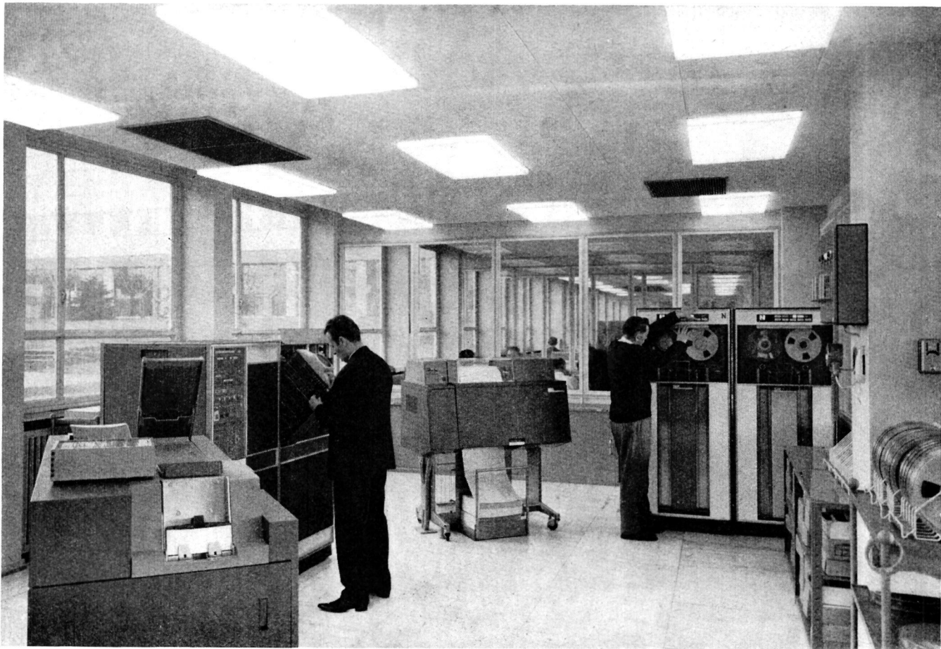
Elektronische Kleinanlage im Statistischen Bundesamt

Rechenarbeiten ist von besonderer Bedeutung, da hier ein maschineller Ablauf für einen größeren Arbeitsbereich in einem Zuge ohne manuelle Eingriffe erfolgt. Damit werden sonst unvermeidliche menschliche Fehlleistungen ausgeschlossen.