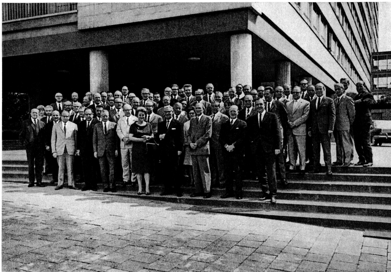
Teilnehmer der 14. Tagung des Statistischen Beirats am 24. und 25. Mai 1966