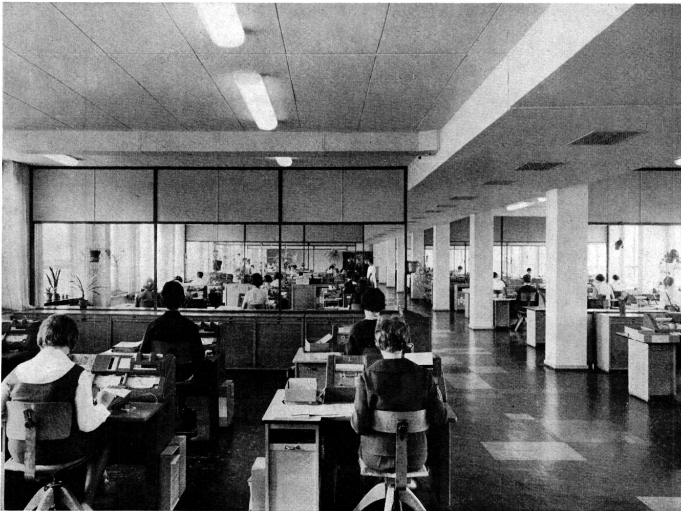
Lochsaal des Statistischen Bundesamtes