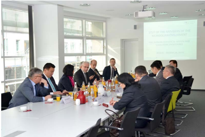
Repräsentantinnen und Repräsentanten des mongolischen Parlaments, des mongolischen Statistikamtes und der mongolischen Botschaft zusammen mit dem damaligen Präsidenten des Statistischen Bundesamtes, Roderich Egeler, und seinen Mitarbeitern am 30. September 2015 im i-Punkt Berlin