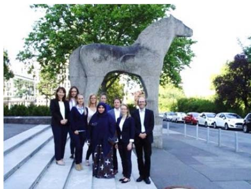
Die Trainees aus dem Statistikamt Abu Dhabi mit Vertreterinnen und Vertretern von Destatis