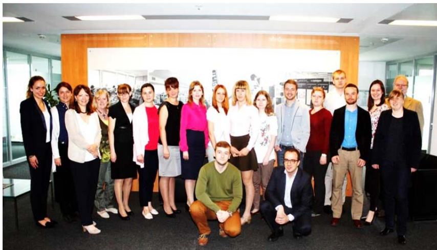
Mitarbeiterinnen und Mitarbeiter des Statistischen Bundesamtes mit Nachwuchskräften aus der Russischen Föderation

Einen weiteren Studienbesuch für Vertreterinnen und Vertreter des Statistikamtes der Russischen Föderation und der beiden Regionalämter Irkutsk und Archangelsk richtete das Statistische Bundesamt im April 2015 zum Thema „Berechnung des Produktionsindex“ aus.