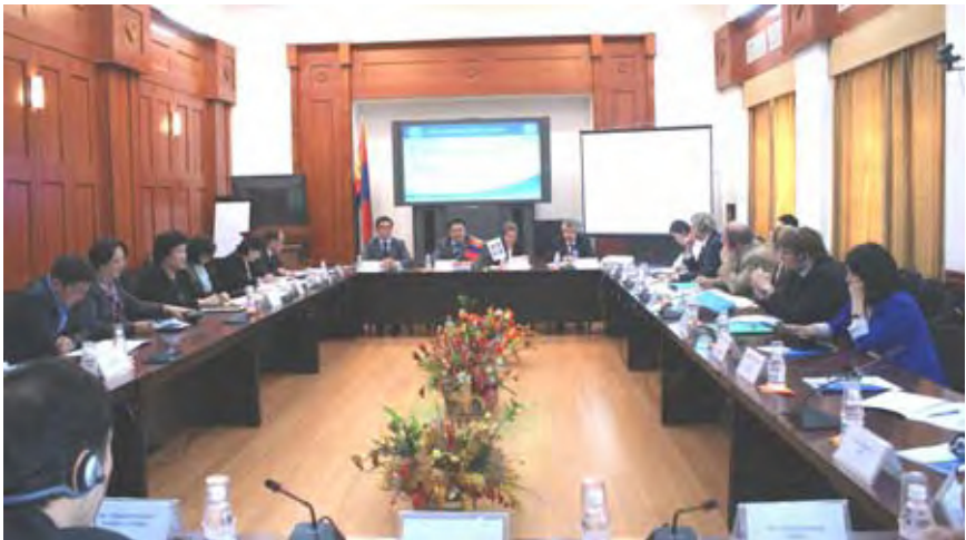
Teilnehmer/-innen der Konferenz im mongolischen Statistikamt in Ulan Bator am 11. Juni 2012

Dank der aktiven Mitwirkung von zahlreichen Experten am Weltbank-Twinning-Projekt zur Weiterentwicklung des nationalen Statistiksystems der Mongolei sind die ersten eineinhalb Jahre äußerst erfolgreich verlaufen. Dies bestätigt das Ergebnis des ersten offiziellen Evaluierungsberichts der Weltbank, der zudem den von Destatis eingesetzten Experten eine sehr hohe Beratungsqualität bei Einsätzen und Studienaufenthalten bescheinigt.