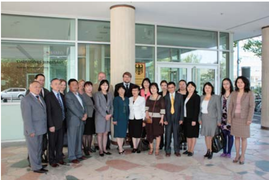
17 Vertreter der regionalen Statistikämter der Mongolei mit Destatis-Mitarbeitern

Ein Höhepunkt des ersten Halbjahres war der Studienbesuch einer Gruppe von 17 Leitern der regionalen Statistikämter der Mongolei vom 23. bis 27. Mai 2011 in Deutschland. Die Gäste besuchten sowohl das Statistische Bundesamt in Wiesbaden und Berlin als auch das Hessische Statistische Landesamt und das Amt für Statistik Berlin-Brandenburg, um mehr über die Organisationsstruktur der deutschen amtlichen Statistik besonders im Hinblick auf die Aufgaben der Statistischen Ämter der Länder zu erfahren.