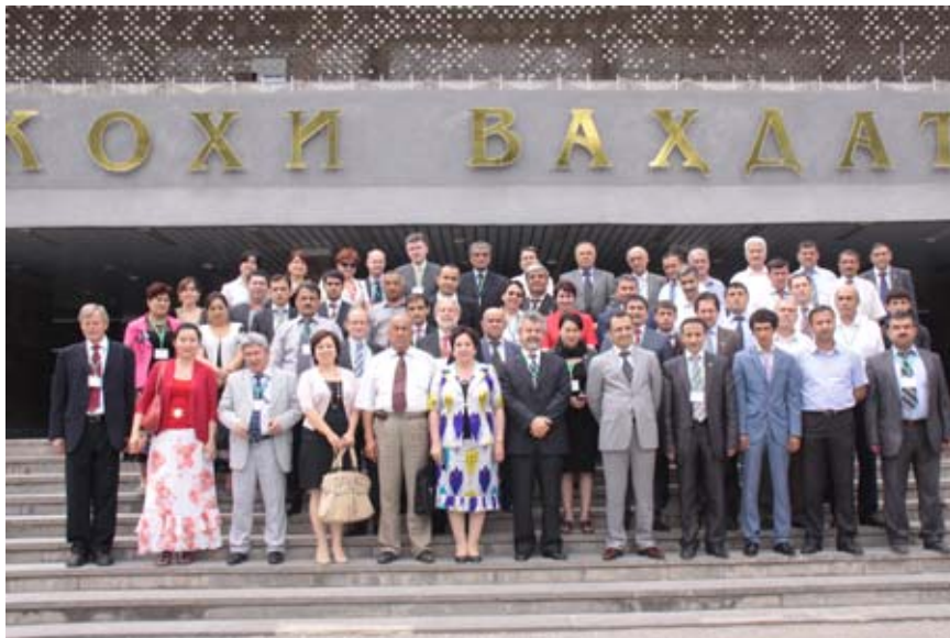
Konferenzteilnehmer vor der Veranstaltungshalle „Kohi Vahdat“

Die mehrjährige Zusammenarbeit im Rahmen eines Twinningprojektes hat sich auszahlt. Die amtliche Statistik Tadschikistans konnte durch die engagierte Beratung näher an internationale Standards herangeführt werden. Die Qualität und Verfügbarkeit vieler Statistiken sowie die Qualifikation der Mitarbeiter des tadschikischen Statistikamtes wurden deutlich verbessert. Neben der Neufassung des tadschikischen Statistikgesetzes, der strukturellen Reorganisation des Statistikamtes und der Verbesserung der statistischen Methodik fanden viele neue Erhebungen statt, für deren Konzeption und Vorbereitung die deutschen und internationalen Experten zur Verfügung standen. Die Erhebungen wurden in den Bereichen Abfall, Arbeitskräfte, Bauleistungen, Einkommen und Lebensbedingungen, Gütertransport sowie landwirtschaftliche Betriebe und Haushalte durchgeführt. Außerdem fanden eine Unternehmenszählung und eine Volkszählung (2010) statt.