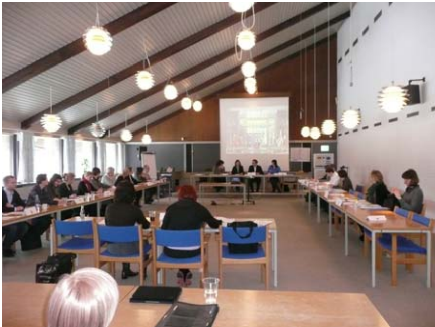
Arbeitssitzung des ESTP-Fortbildungskurses für Gremienarbeit in Slangerup/Dänemark

rung. Unterteilt in diese Arbeitsprozesse wurden die zugehörigen Gremien von Europäischer Kommission, Europäischem Parlament und Rat der Europäischen Union präsentiert und ihre Arbeitsmethodik und -anforderungen vorgestellt. Viele praktische Übungen gaben zudem Möglichkeit, die anderen Kolleginnen und Kollegen kennenzulernen und von ihrem unterschiedlichen Erfahrungsstand in der Gremienarbeit zu lernen.