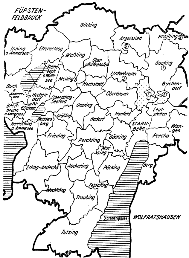
Ausschnitt aus der Gemeindegebietskarte des Landkreises Starnberg in Originalgröße

Preis 10,— DM. Zu beziehen durch den Buchhandel oder direkt durch das Bayerische Statistische Landesamt — Verkaufsstelle für Veröffentlichungen — München 2, Neuhauser Straße 51.