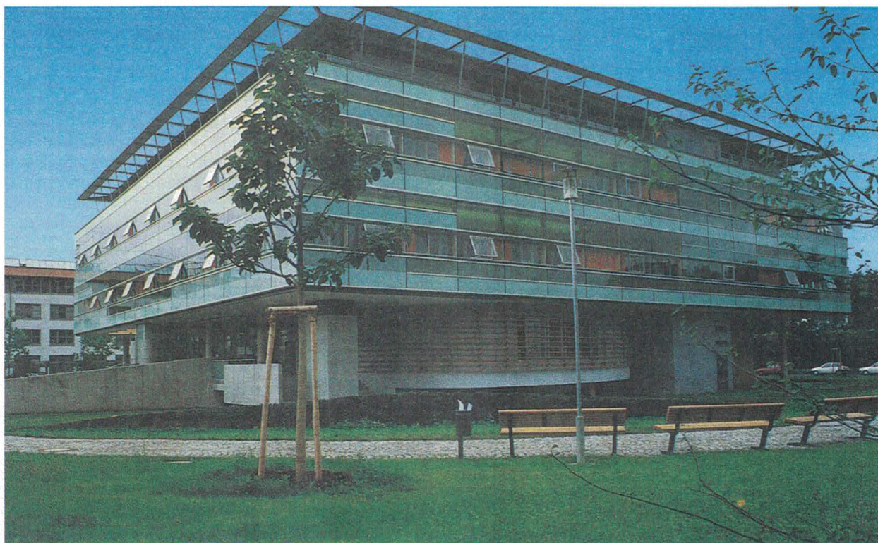
Das neue Amtsgebäude von Westen aus gesehen

Mal ihre Konkurrenzfähigkeit gegenüber privaten Bauträgern und Investoren unter Beweis gestellt. An einige Daten sei erinnert: