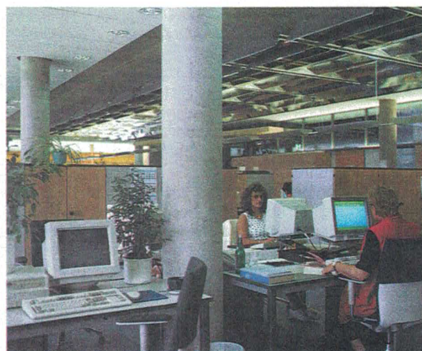
Einer der 16 Gruppenarbeitsräume

Wir erlebten gerade in den historischen Beschlüssen über den Gründungsteilnehmerkreis der Europäischen Währungsunion Anfang Mai, welche weitreichende Bedeutung (allein mit Blick auf die Erfüllung der Konvergenzkriterien) für Deutschland qualitativ hochwertiges statistisches Datenmaterial hat.