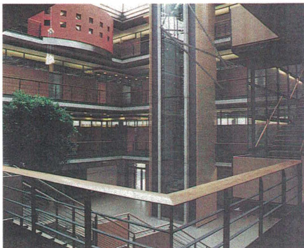
Atrium mit gläsernem Aufzug

Das Landesamt ist aber nicht nur die zentrale Statistikbehörde des Freistaates Bayern; es ist zugleich Dienstleistungszentrum im Bereich der Informations- und Kommunikationstechnik in der öffentlichen Verwaltung. Das neue Haus in Schweinfurt ist für beide Tätigkeitsfelder gerüstet und dazu mit modernster Technik ausgestattet worden. Die Mitarbeiter des Landesamts wirken hier zum einen an einer Vielzahl wichtiger Statistiken mit, wobei zur Datenübermittlung die lokalen Datennetze Schweinfurt und München über das bayerische Behördennetz miteinander verbunden sind. Zum anderen werden in diesem Hause künftig Angehörige des öffentlichen Dienstes in Fachseminaren, Lehrgängen und Workshops auf dem Gebiet der Information und Kommunikation aus- und fortgebildet. Damit leistet die Außenstelle des Bayerischen Landesamtes für Statistik und Datenverarbeitung einen wichtigen Beitrag für die Modernisierung und Effizienz der Staatsverwaltung.