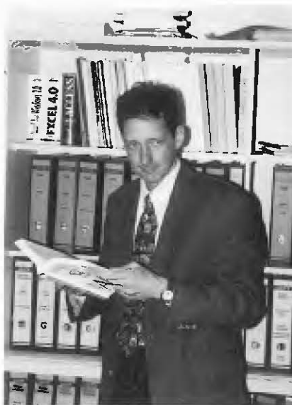
Der Autor: Dipl.-Geograph Michael Walker ist Referent im Referat „Handel und Verkehr“ des Statistischen Landesamts Baden-Württemberg.

von beachtlichen 5,1 %. Damit scheinen die Exporte von Baden-Württemberg nach einer 4jährigen Stagnationsphase und einem kräftigen Schub von beinahe 10 % in 1994 wieder an die bisher gewohnten Wachstumsraten anzuknüpfen.