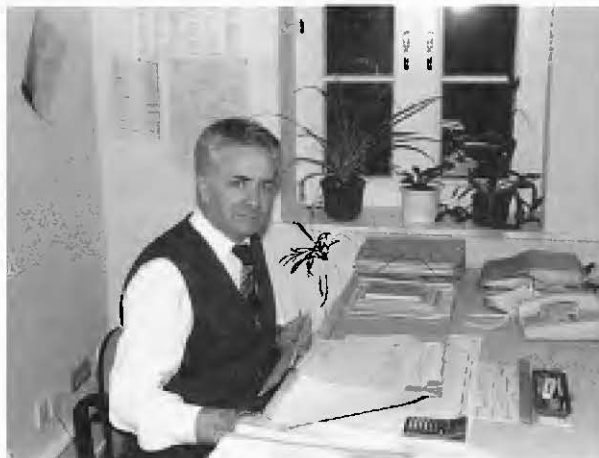
Der Autor: Dipl.-Volkswirt Engelbert Drißner ist Leiter des Referats „Steuern“ des Statistischen Landesamts Baden-Württemberg.

weniger als acht Jahre existieren. Im Jahre 1995 entfielen auf diese „jungen“ Unternehmen 74,3 % der erfaßten Konkurs- und Vergleichsverfahren insgesamt (Tabelle 2). Dieses Verhältnis bewegt sich schon seit Jahren in dieser Größenordnung. 2 Erkenntnisse über Insolvenzursachen aus Analysen der Deutschen Bundesbank 3 und dem Zentrum für Europäische Wirtschaftsforschung (ZEW) 4 ergeben einen Katalog von Insolvenzrisiken, denen junge Unternehmen wohl verstärkt ausgesetzt sind. Eine der häufigsten Ursachen für das Scheitern eines Unternehmens