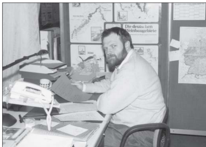
Der Autor: Dipl.-Ing. agr. Thomas Betzholz ist Leiter des Referats "Pflanzliche und tierische Produktion, Flächenerhebung, Landwirtschaftliche Gesamtrechnungen" im Statistischen Landesamt Baden-Württemberg.

Doch leider kann Schätzen auch fehlen. Aufgrund der herausragenden Stellung des Apfelanbaus in der heimischen Obstproduktion wird die Berichterstattung hier um exakte, auf Stichprobenbasis vorzunehmende Erntemessungen ergänzt. So-