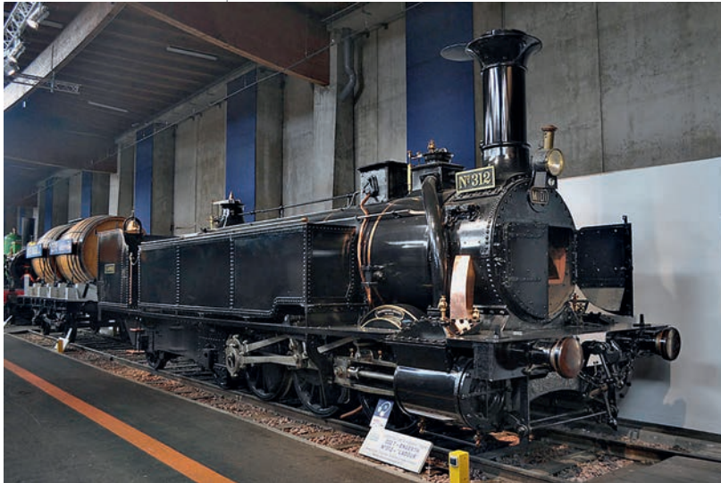
Abbildung 2: Eine württembergische Lok aus dem Jahre 1856

Ulm, von da aus die Südbahn nach Friedrichshafen am Bodensee, die Westbahn in das in Baden gelegene Bruchsal und die Nordbahn über Bietigheim nach Heilbronn realisiert.