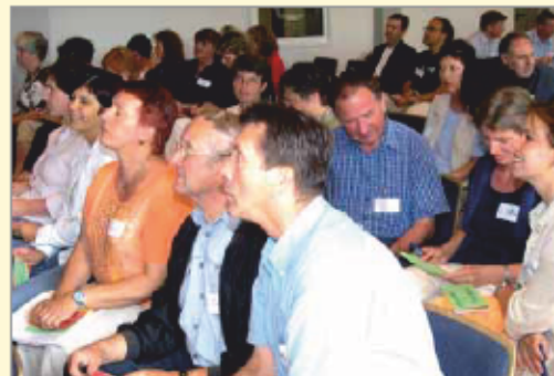
Zukunftswerkstatt in Kehl

Interessierte Bürger/-innen und örtliche Fachleute kommen zur eintägigen Zukunftswerkstatt zusammen. Gemeinsam werden Zielvorstellungen für die nächsten 5 bis 10 Jahre entwickelt. Daraus werden die nächsten wichtigsten Schritte und Maßnahmen für die verschiedenen Handlungsfelder abgeleitet.