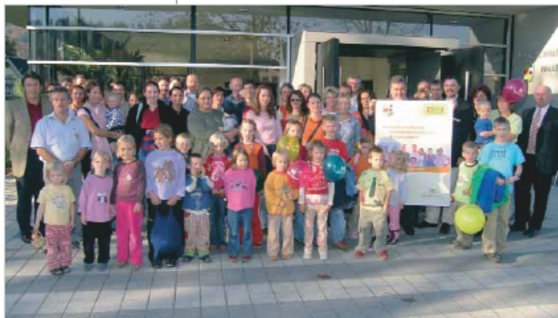
Die Zukunftswerkstatt Berghaupten nimmt ihre Arbeit auf.