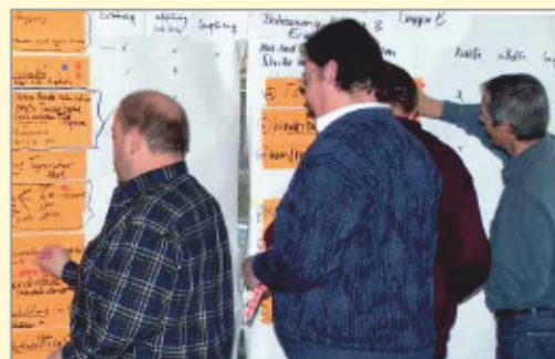
Klausursitzung des Gemeinderats in Steißlingen

Die Ergebnisse der Zukunftswerkstatt und der daraus erstellte Maßnahmenplan werden dem Gemeinderat vorgestellt und eingehend diskutiert. Der Gemeinderat beauftragt die Verwaltung mit der Umsetzung der Maßnahmen.