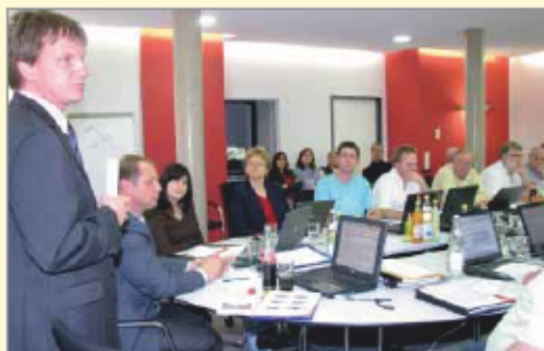
Gemeinderatssitzung in Tuningen

Ein Planungsgespräch mit der Gemeindegemeinschaft findet statt. Unter Berücksichtigung des Stärken-Schwächen-Profiles werden die in Frage kommenden Handlungsfelder zur Familienfreundlichkeit festgelegt.