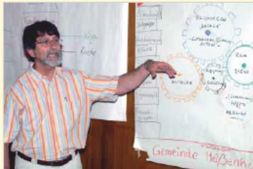
Ergebnispräsentation in Meißenheim

Der Gemeinderat informiert sich über den Ablauf der Zukunftswerkstätten und beschließt die Teilnahme der Kommune. Das Beteiligungsverfahren wird nach dem Konzept der Familienforschung Baden-Württemberg, im Auftrag des Ministeriums für Arbeit und Soziales und in Zusammenarbeit mit dem Kommunalverband für Jugend und Soziales durchgeführt.