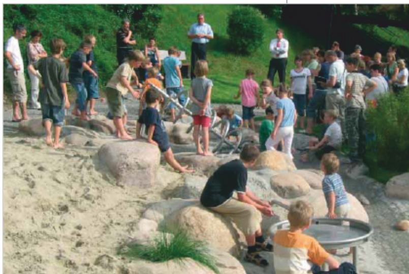
Bürgermeister Jürgen Schäfer eröffnet den neuen Naturerlebnis-Spielplatz in Berghaupten.

Bürgermeister Jörg Albrecht aus Mauer (3 900 Einwohner, Rhein-Neckar-Kreis) geht bei der Beteiligung des Gemeinderats noch einen Schritt weiter: „Wir haben drei Gemeinderäte, die selbst familienfreundliche Projekte mit um-