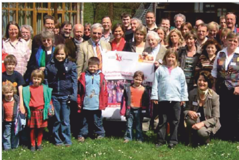
Knapp 100 Teilnehmer/-innen kamen zur Zukunftswerkstatt in Pforzheim – auch die Kinder stellten ihre Ideen vor.

In Simmozheim (2 800 Einwohner, Landkreis Calw) ist aus der Zukunftswerkstatt das Projekt „ABS – Aktive Bürger Simmozheim“ hervorgegangen. Die „Aktiven Bürger“ entwickeln Begegnungs- und Freizeitangebote für Alt und