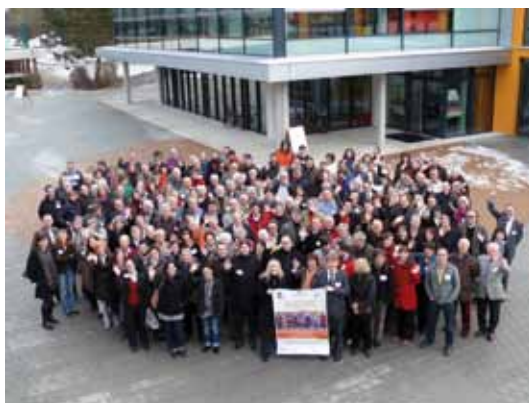
Zukunftswerkstatt Ehingen 2012

Das Internetportal www.familienfreundliche-kommune.de ist mittlerweile als Informationskanal sehr gut etabliert. Über den Newsletter