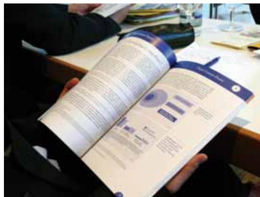
Expertise „Dual Career“

Besonderes Know-How hat das Kompetenzzentrum zu den Zukunftsthemen „Dual Career“ und „Elder Care“ aufgebaut. 2012 erschien zum Beispiel im Rahmen eines von der Robert Bosch Stiftung geförderten Forschungsprojekts das „Praxishandbuch Dual Career“. Das Praxishandbuch basiert auf einer deutschlandweiten Befragung von Unternehmen und Dual Career Netzwerken. Es bietet einen Überblick zum derzeitigen Stand der Dual Career Förderung