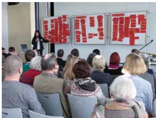
Hohenheimer Tage 2011

Jede Tagung steht unter einer besonderen Fragestellung. Bei der ersten Tagung 2007 wurde das