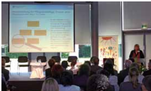
RegioKonferenz – Momentaufnahme

Die Ergebnisse der Konferenz und ihrer Workshops werden den Teilnehmerinnen und Teilnehmern und anderen interessierten Kommunen und Unternehmen in Form von Arbeitshilfen und Handreichungen zur Verfügung gestellt.