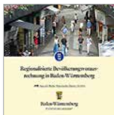
Artikel-Nr.: 2117 14001 Preis: 27,00 Euro (zuzüglich Versandkosten)

Telefon: 0711/641-28 66 Fax: 0711/641-13 40 62 vertrieb@stala.bwl.de