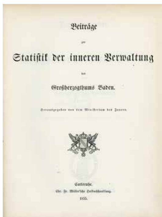
Abbildung 1: Aus den Beiträgen zur Statistik der inneren Verwaltung

In Baden begannen die ersten offiziellen Bestrebungen 1836 mit einer Anordnung des großherzoglichen Innenministeriums, dass zum Zwecke der Bearbeitung einer Landesstatistik eine Kommission gebildet werde. Die Kommission bestand aus je einem Mitglied