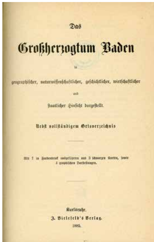
Abbildung 4: Aus „Das Großherzogtum Baden“

Behörden geschieht, als eine dem Ministerium des Innern untergeordnete Zentralbehörde das Statistische Bureau betraut, welches in der Folge die Bezeichnung Statistisches Landesamt zu führen hat.“ In einer Dienstanweisung des Jahres 1902 wurden die Befugnisse des Statistischen Landesamtes Baden noch einmal wesentlich erweitert.