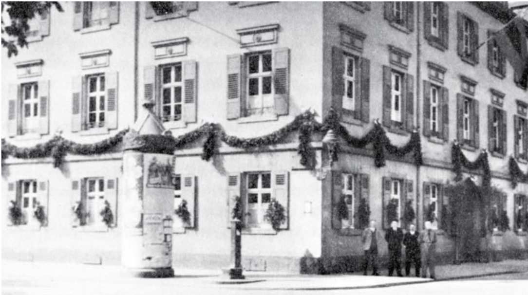
Abbildung 6: Das ehemalige Amtsgebäude in der Akademiestraße in Karlsruhe

wälzungen im Staatsleben durch das nationalsozialistische Regime ab. Die Eigenstaatlichkeit der Länder wurde mehr und mehr beschränkt, was sich auf dem Gebiet der Landesstatistik dahin auswirkte, dass die Statistischen Landesämter zu reinen Aufbereitungsstellen der vom Reich bzw. vom Statistischen Reichsamt angeordneten Statistiken wurden. In dieser Zeit übernahm Paul Hauser die Leitung des Statistischen Landesamtes Baden. In die Amtszeit Hausers fiel die Aufbereitung zweier großer Volkszählungen (1933 und 1939). In dieser Zeit war die Situation des Amtes nicht nur in sachlicher, sondern auch in personeller Hinsicht sehr schwierig. Seit Beginn des Zweiten Weltkriegs wurden aufgrund der zunehmenden Remilitarisierung und kriegswirtschaftlichen Planungen vielen möglichen statistischen Veröffentlichungen der Boden entzogen, obwohl genügend Datenmaterial vorlag. Die Veröffentlichung anderer Statistiken wurde dadurch verhindert, dass immer mehr erhobene Daten zur Geheimsache erklärt wurden. 1943 wurde das Archiv des Statistischen Landesamtes Baden in das Bruchsaler Schloss verlagert. Gegen Ende des Kriegs ging dieses historische Bauwerk und mit ihm die dort eingelagerten Archivbestände ebenso in Flammen auf wie das Amtsgebäude in Karlsruhe (Abbildung 6), sodass einzigartige regionalstatistische Kulturgüter für die Nachwelt unrettbar verloren gingen. 5