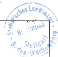
Stimmenanteile bei den Wahlen der Gemeinderäte 1994

Vorläufige Ergebnisse der Wahlen der Gemeinderäte und Kreisträte in Baden-Württemberg sowie der Regionalversammlung des Verbands Region Stuttgart am 12. Juni 1994