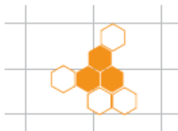
Schaubild des Monats