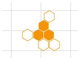
Schaubild des Monats