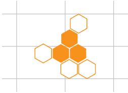
Schaubild des Monats