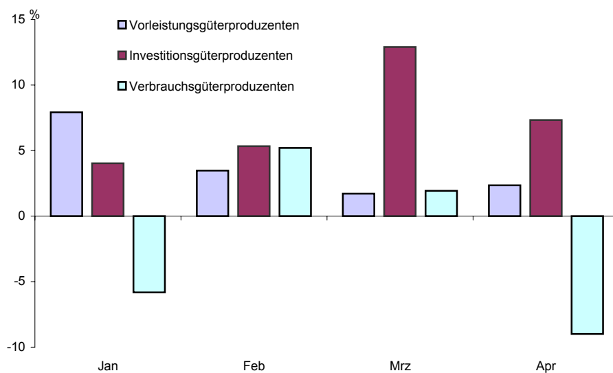
Umsatz des Verarbeitenden Gewerbes in Berlin seit Januar 2004 nach ausgewählten Hauptgruppen Veränderung gegenüber dem gleichen Monat des Vorjahres in %