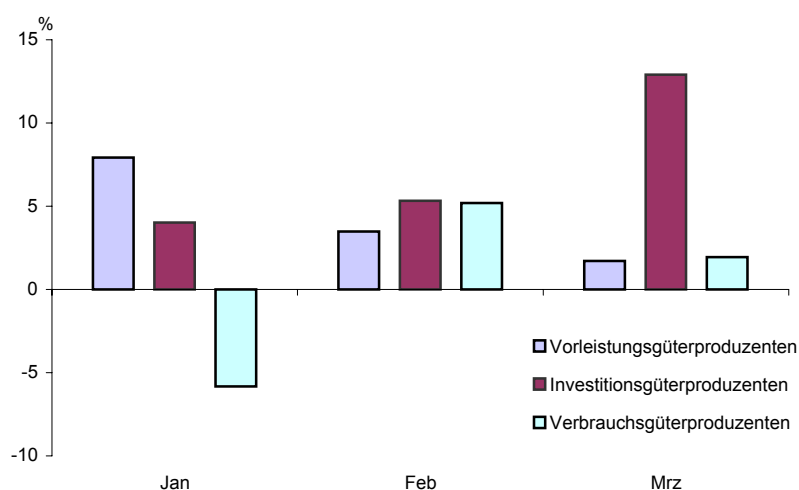
Umsatz des Verarbeitenden Gewerbes in Berlin seit Januar 2004 nach ausgewählten Hauptgruppen Veränderung gegenüber dem gleichen Monat des Vorjahres in %

Herausgegeben im Mai 2004 Erscheinungsfolge monatlich