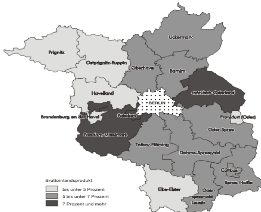
Anteil des Bruttoinlandsprodukts der Verwaltungsbezirke am Land Brandenburg insgesamt im Jahr 1998