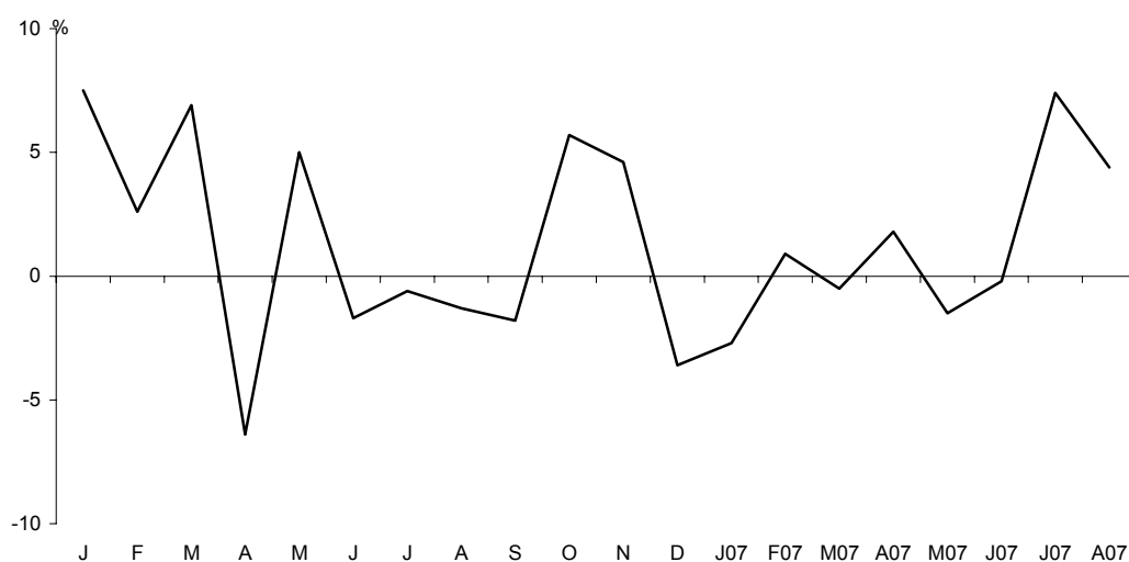
Umsatz des Verarbeitenden Gewerbes in Berlin seit Januar 2006 Veränderung gegenüber dem gleichen Monat des Vorjahres in %