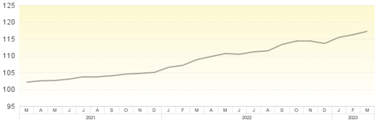
Veränderung gegenüber dem entsprechenden Vorjahresmonat - Jahresteuerungsrate -