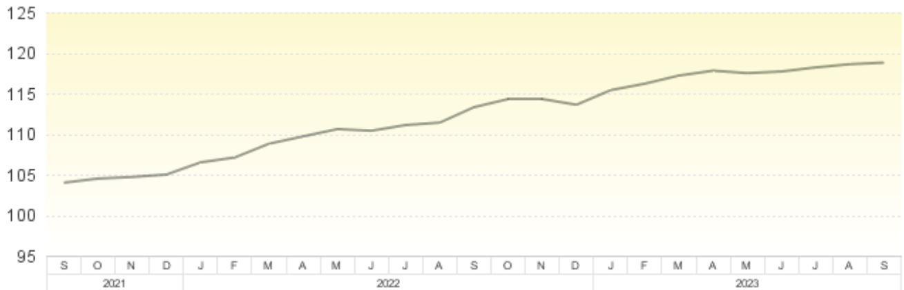
Veränderung gegenüber dem entsprechenden Vorjahresmonat - Jahresteuerrate -