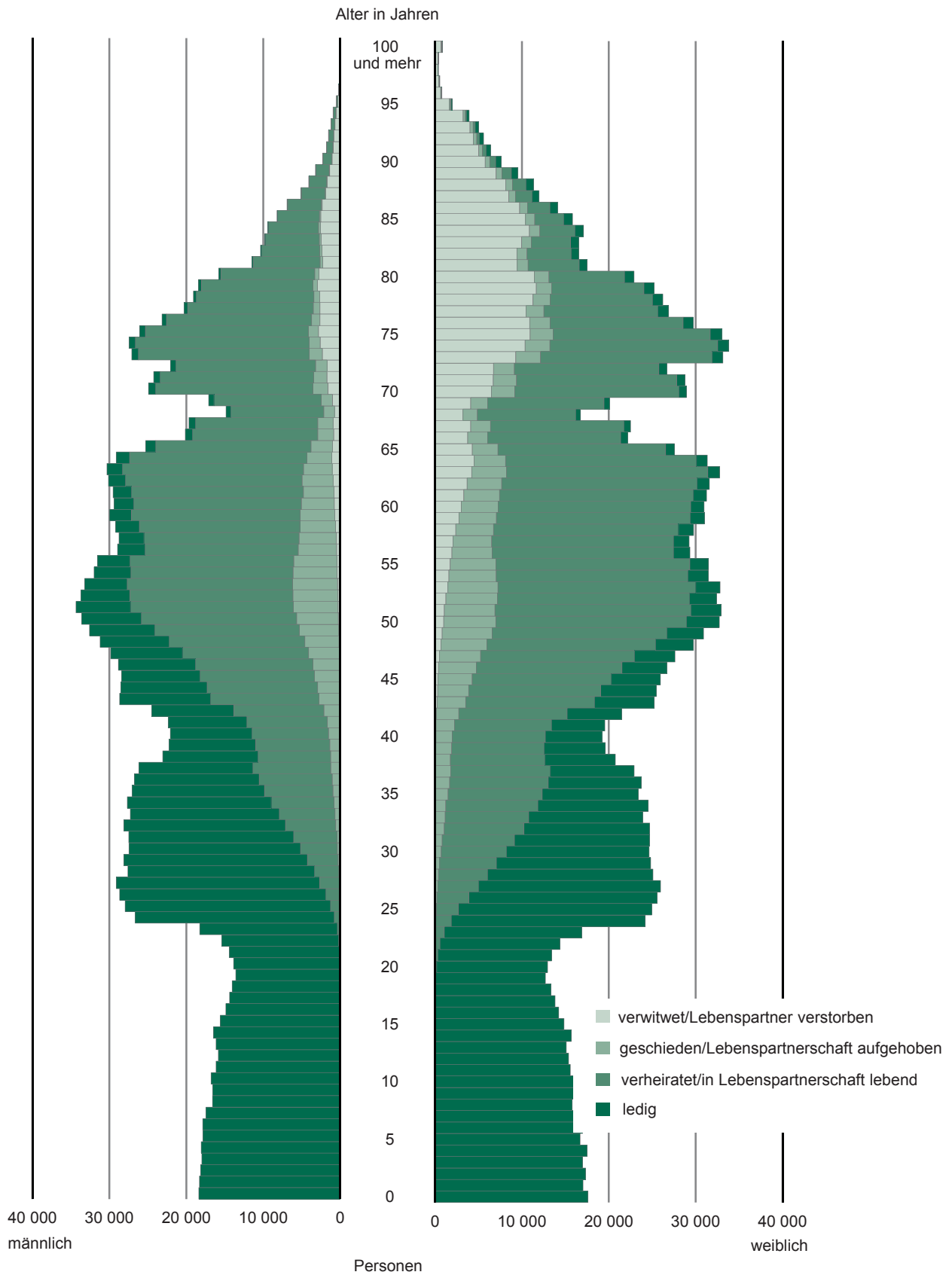
Abb.1 Bevölkerung des Freistaates Sachsen am 31. Dezember 2014 nach Alter, Geschlecht und Familienstand