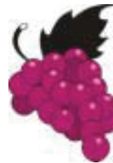
Abb. 3 2004er Jahrgang wichtiger Rebsorten