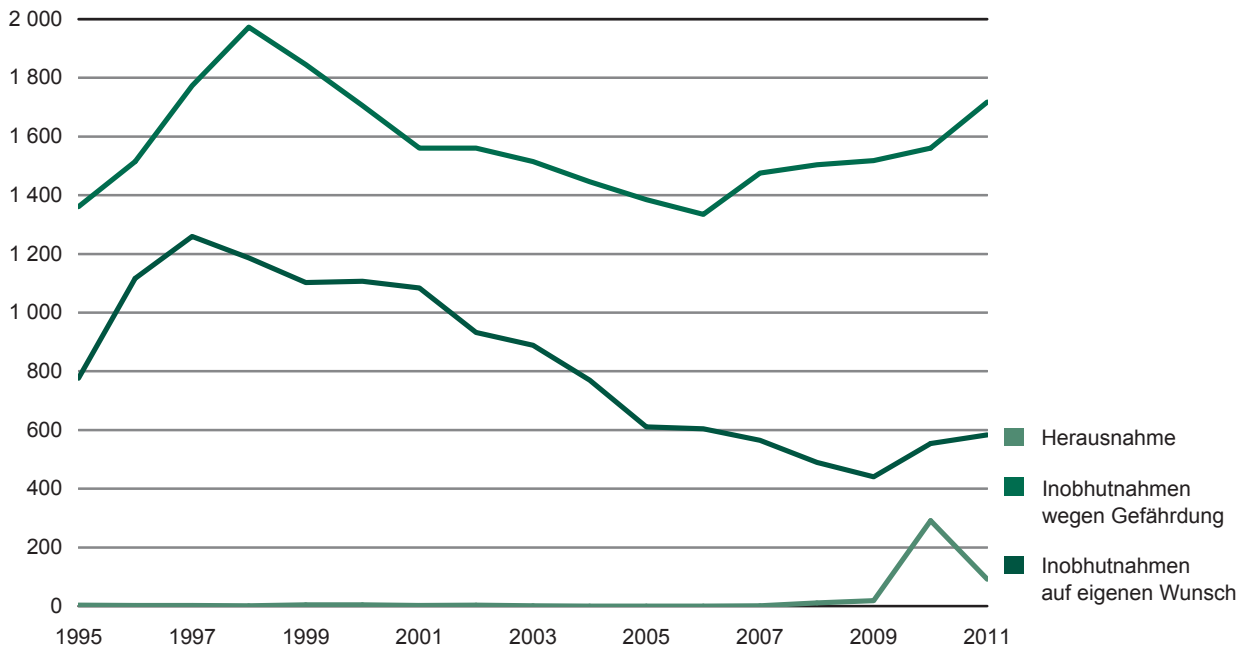
Abb. 2 Vorläufige Schutzmaßnahmen für Kinder und Jugendliche 1995 bis 2011 nach Alter