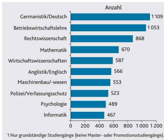
Studienanfänger/-innen im ersten Hochschulsemester 2017 nach den zehn am häufigsten belegten grundständigen Studienfächern 1

grund von Uneindeutigkeiten und einer kaum zu verarbeitenden Vielfalt nicht mehr möglich ist. Statt rationaler Entscheidungsmechanismen und rationaler Begründbarkeit treten in Reaktion auf die Multioptionalität vermehrt alternative Heuristiken und Entscheidungsstrategien auf. Dazu gehört das Trial-and-Error-Prinzip: Studiengänge werden ausprobiert und gegebenenfalls mehrfach gewechselt.