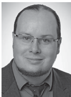
Von Dr. Marco Schröder

Erstmals seit 1999 verzeichnen die Hochschulen in Rheinland-Pfalz nahezu stagnierende Studierendenzahlen. Gleichwohl müssen die Hochschulen ihre Bildungsangebote an eine in Bezug auf Herkunft, Geschlecht und Vorbildung zunehmend heterogener werdende Studierendenschaft anpassen. Die Daten und Kennzahlen der amtlichen Hochschulstatistik geben Hinweise darauf, wie erfolgreich die Hochschulen mit den aktuellen Herausforderungen umgehen.