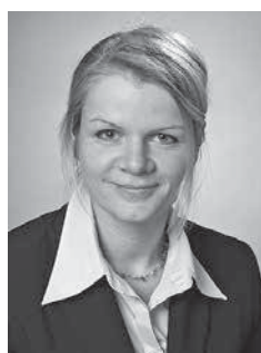
Von Bettina Link

Die Hochschulen verzeichnen seit 15 Jahren einen kräftigen Anstieg der Studierendenzahlen. Ursächlich hierfür sind die demografische Entwicklung und die anhaltend steigenden Studienberechtigtenzahlen. Darüber hinaus erhöhten bis zum Jahr 2013 immer wieder doppelte Abiturjahrgänge in einigen Bundesländern die Studierendenzahlen zusätzlich. Für die Hochschulen ergab sich damit die Notwendigkeit eines massiven Ausbaus der Studienkapazitäten. Zudem müssen sie ihre Bildungsangebote an eine in Bezug auf Herkunft, Alter und Vorbildung zunehmend heterogener werdende Studierendenschaft anpassen. Die Daten und Kennzahlen der amtlichen Hochschulstatistik geben Hinweise darauf, wie erfolgreich die Hochschulen mit den aktuellen Herausforderungen umgehen.