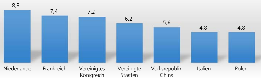
Die wichtigsten Ursprungsländer der Einfuhr Niedersachsens 2017 Anteil an der Gesamteinfuhr in %