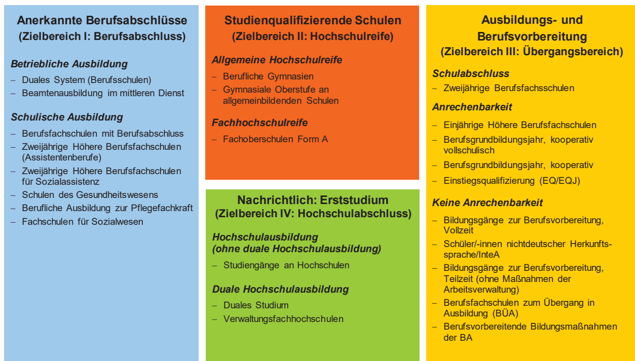
Abbildung 1: Das Zielbereiche-Modell

Quelle: Anger et al., 2007 1 , Erweiterungen: Hessisches Statistisches Landesamt.