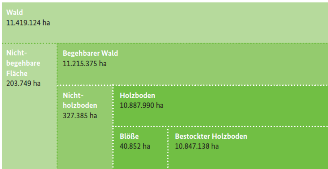
Abbildung 1: Schematische Darstellung der Waldflächenkomponenten nach BWI 2012