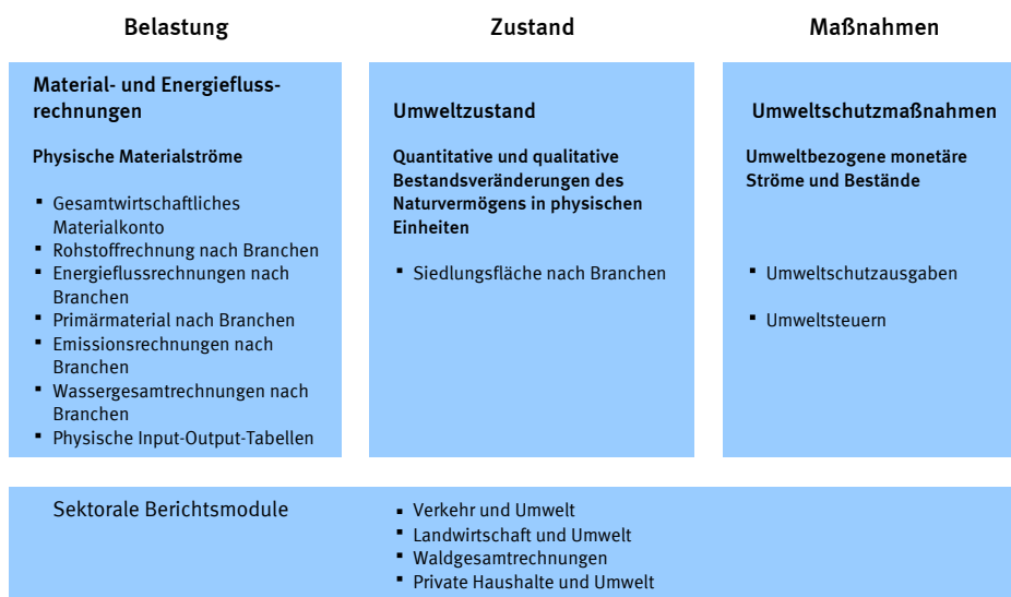
Abb 2 Module der deutschen Umweltökonomischen Gesamtrechnungen

Beim Modul Umweltzustand wird in den deutschen UGR bisher nur der Naturvermögensbestandteil „Bodenfläche“ dargestellt. So wird betrachtet, wie die Bodenfläche genutzt werden und insbesondere wie sich die Siedlungs- und Verkehrsfläche entwickelt. Eine Zuordnung zu wirtschaftlichen Akteuren wäre wünschenswert, kann derzeit aber nicht realisiert werden. Landschaften und Ökosysteme sind ein wesentlicher Bestandteil des Naturvermögens, der im Prinzip dargestellt werden sollte. Diese Arbeiten werden allerdings in den UGR nicht weiter verfolgt. Wichtige Informationen aus diesem Themenspektrum sind aber beim Bundesamt für Naturschutz (BfN) verfügbar. Die Darstellung der Bestände an Bodenschätzen – ein dritter Aspekt des Naturvermögens, der für rohstoffreiche Länder von großer Bedeutung sein kann – hat für die deutschen UGR nur geringere Priorität und wurde daher nicht in die Berichterstattung aufgenommen. Für den Wald sowie für die Landwirtschaft wurde bisher ein eigenes Berichtsmodul entwickelt (siehe unten).