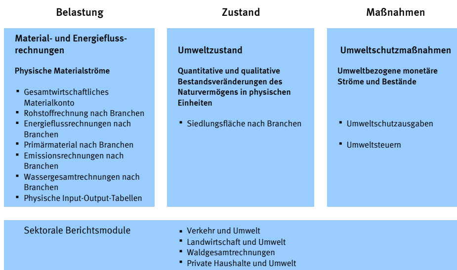
Abb 2 Module der deutschen Umweltökonomischen Gesamtrechnungen

Beim Modul Umweltzustand wird in den deutschen UGR bisher nur der Naturvermögensbestandteil „Bodenfläche“ dargestellt. So wird betrachtet, wie die Bodenfläche genutzt werden und insbesondere wie sich die Siedlungs- und Verkehrsfläche entwickelt. Eine Zuordnung zu wirtschaftlichen Akteuren wäre wünschenswert, kann derzeit aber nicht realisiert werden. Landschaften und Ökosysteme sind ein wesentlicher Bestandteil des Naturvermögens, der im Prinzip dargestellt werden sollte. Diese Arbeiten werden allerdings in den UGR nicht weiter verfolgt. Wichtige Informationen aus diesem Themenspektrum sind aber beim Bundesamt für Naturschutz (BfN) verfügbar. Die Darstellung der Bestände an Bodenschätzen – ein dritter Aspekt des Naturvermögens, der für rohstoffreiche Länder von großer Bedeutung sein kann – hat für die deutschen UGR nur geringere Priorität und wurde daher nicht in die Berichterstattung aufgenommen. Für den Wald sowie für die Landwirtschaft wurde bisher ein eigenes Berichtsmodul entwickelt (siehe unten).