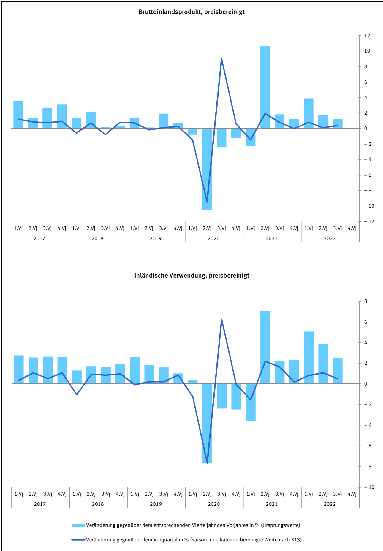
Schaubild 1: Bruttoinlandsprodukt und Inländische Verwendung