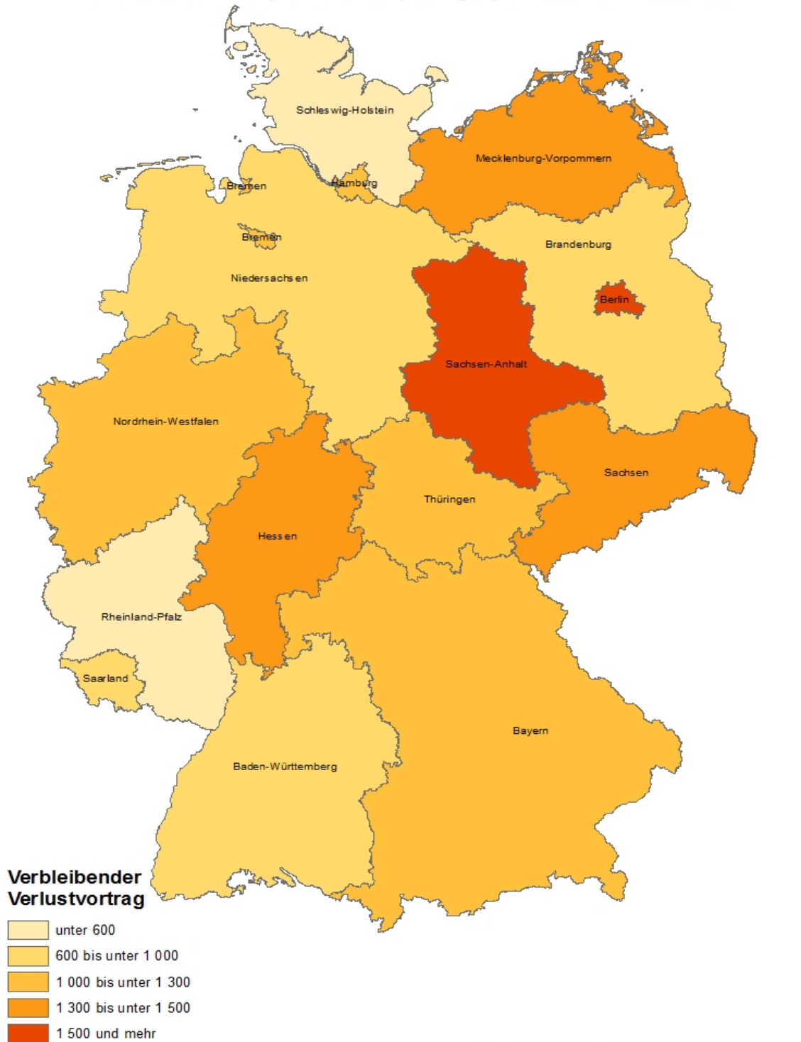
Durchschnittlicher verbleibender Verlustvortrag der unbeschränkt Körperschaftsteuerpflichtigen je Bundesland in 1000 EUR